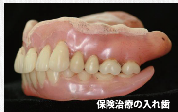
保険治療の入れ歯