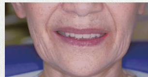
自費治療の入れ歯装着時

保険治療の入れ歯から自費治療の入れ歯へ。齧の軽減や骨格が変化しているのが一目瞭然。