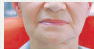
保険治療の入れ歯装着時

さまり噛むのが痛いといった状態になります。自分に合っていない入れ歯を使い続けると、顎がゆがみ、それが体全体へと影響を及ぼします。また、年齢よりも老けて見まったり、顔が曲がってしまったという、人に与