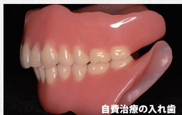
自費治療の入れ歯

自費治療の入れ歯は、保険治療の入れ歯に比べ、その人が若く健康だった頃の歯肉と歯茎を再現できる。